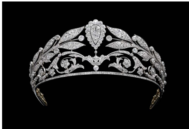
Diadème feuilles de lauriers, diamants et platine Joseph Chaumet, 1920. Collection privée.