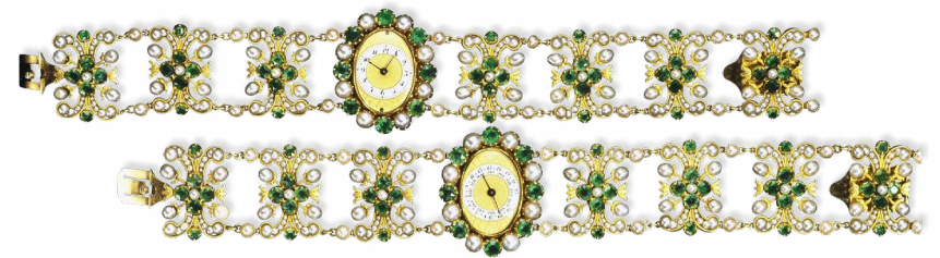
Paire de bracelets-montres d'Auguste-Amélie de Bavière, l'une indiquant l'heure et l'autre la date, or, émeraudes et perles fines François-Regnault Nitot, vers 1811. Collection Chaumet Paris.