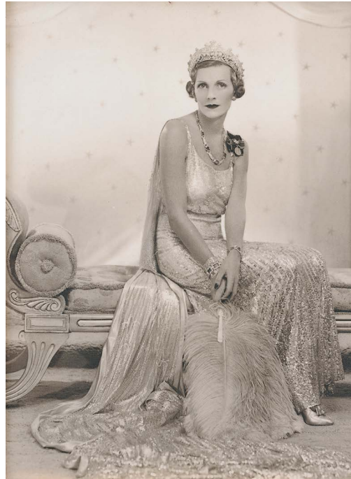
Portrait d'Edwina, comtesse Mountbatten de Birmanie, dernière vice-reine des Indes, portant son diadème Chaumet pour le couronnement de George VI